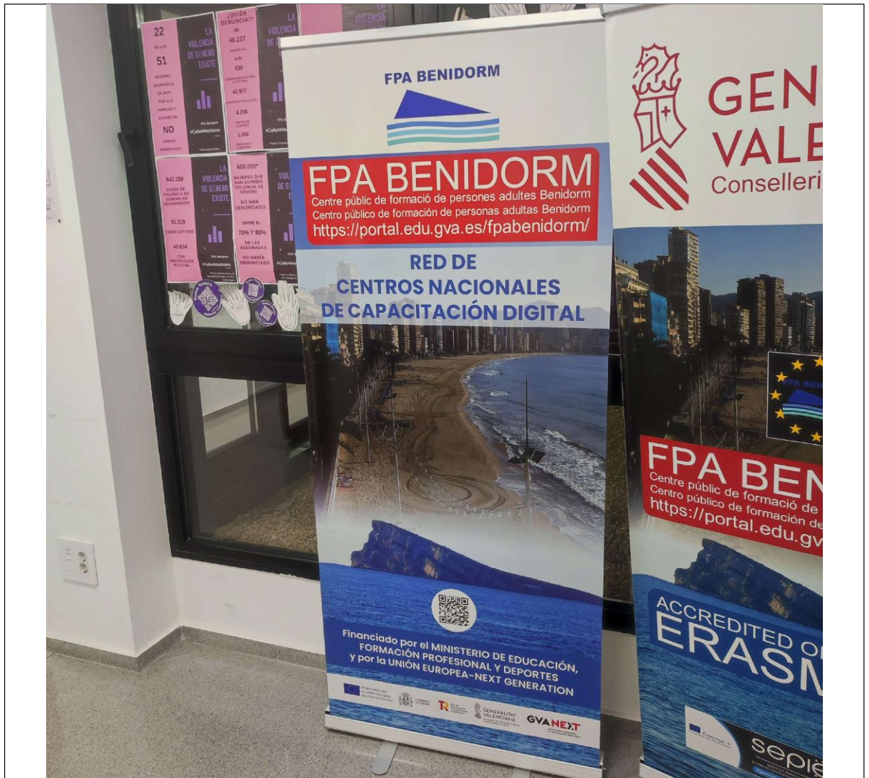
- Cartel entrada aula.