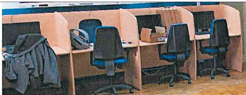
Figura 6. Panorámica PCs factura 1 y monitores factura 2