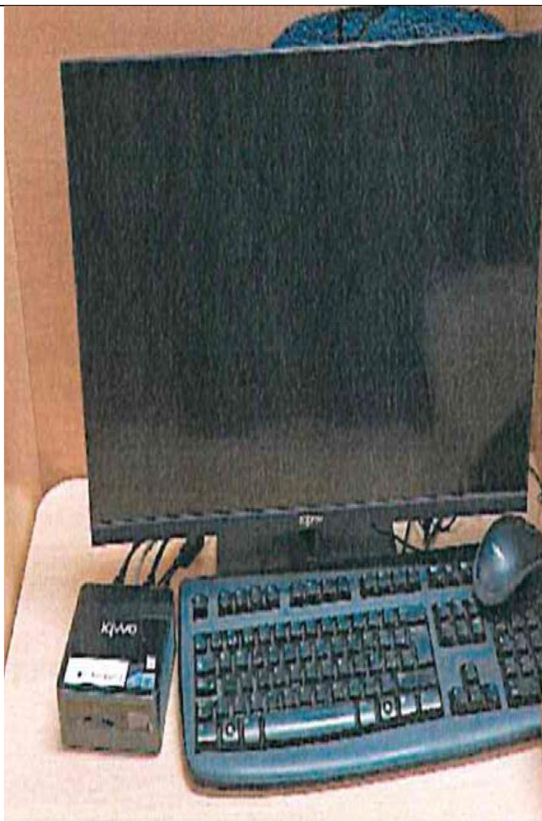
Figura 4. PC factura 1 monitor factura 2