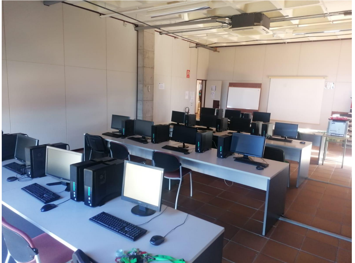
-Espacio de formación dotado del material tecnológico