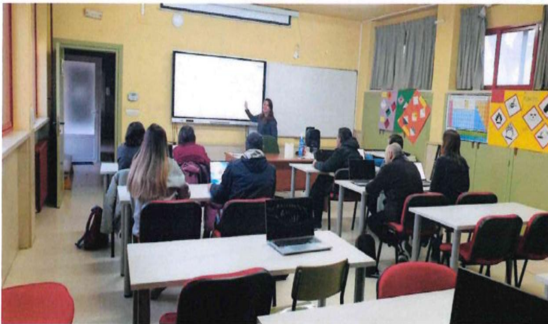
Grupo de octubre 2023. Detalle de una sesión