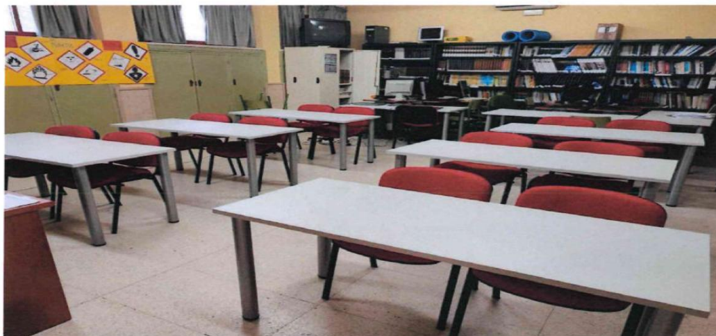
Disposición del material mobiliario adquirido para el curso. Sillas y mesas