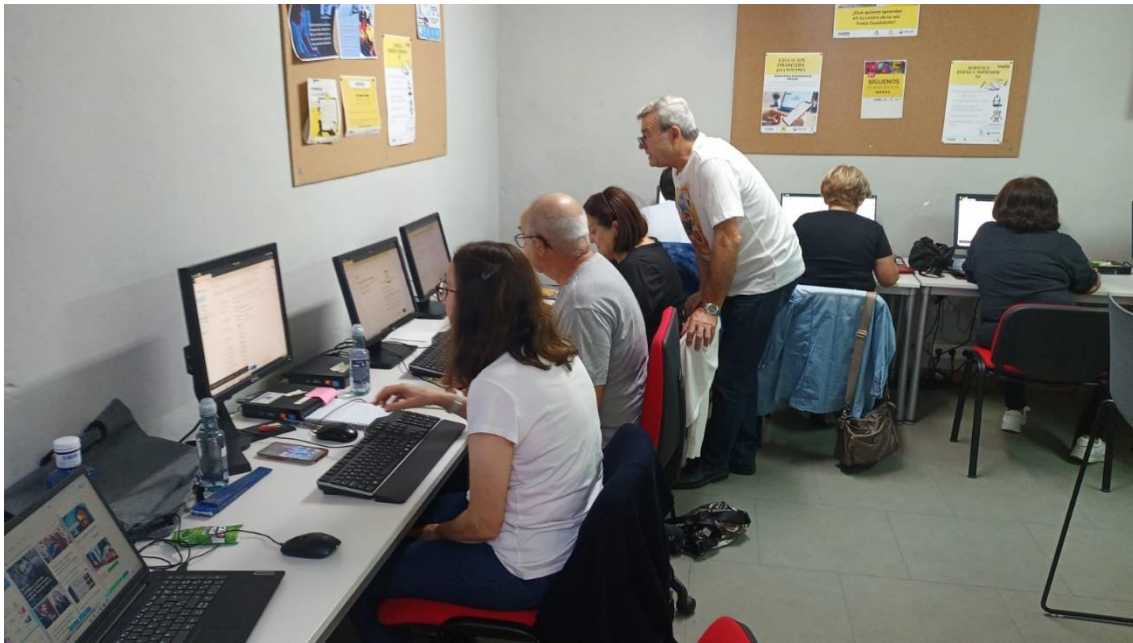
Publicación en Facebook