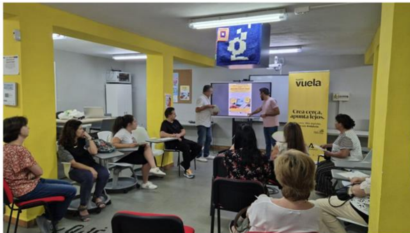
Casi un centenar de vecinos participan en los cursos de capacitación digital que se imparten en Iznájar y sus aldeas

Ayuntamiento - Áreas Municipales - Ciudadanía - Turismo - Aldeas - El Embalse - Transparencia - Sede electrónica