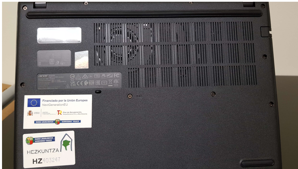
Vídeo protagonizado por los alumnos y alumnas

https://www.youtube.com/watch?si=xnXR3rllGNMAiwBw&v=g3xG6yppPMU&feature=youtu.be