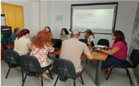
2ª Formación en Medina Sidonia