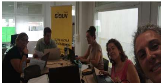
Formación en San José del Valle