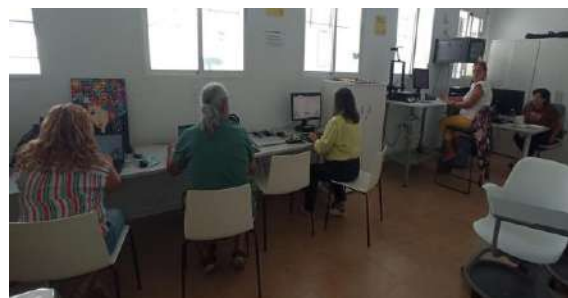
Formación en Zahara de los Atunes