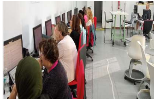
2ª Formación en Benalup Casas Viejas