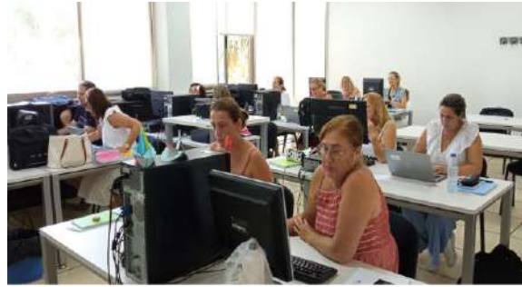
1ª Formación en Paterna de Rivera