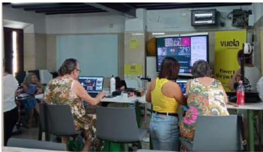
2ª Formación en Paterna de Rivera