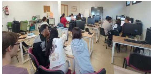
1ª Formación en Benalup Casas Viejas