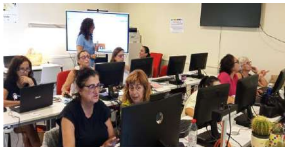
2ª Formación en Conil de la Frontera