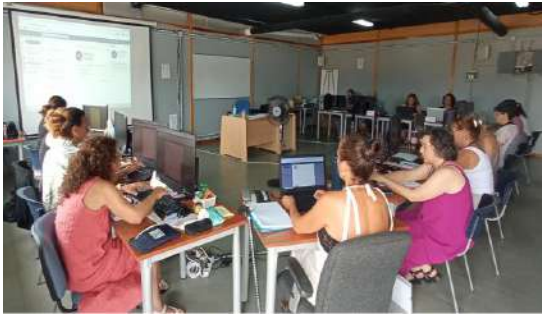
1ª Formación en Conil de la Frontera