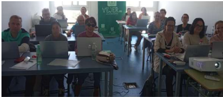
Formación en Vejer de la Frontera