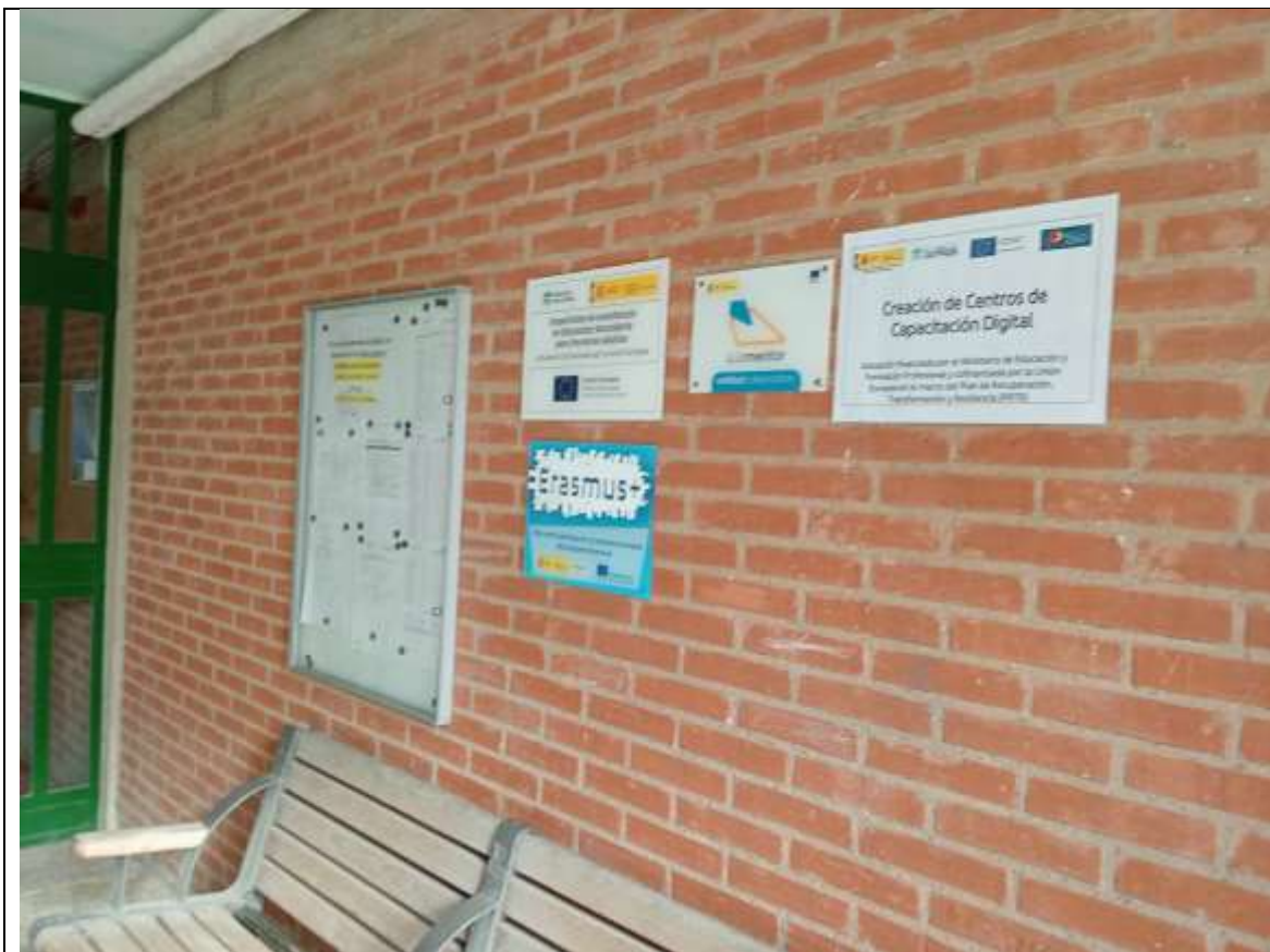
Foto del aula de capacitación digital