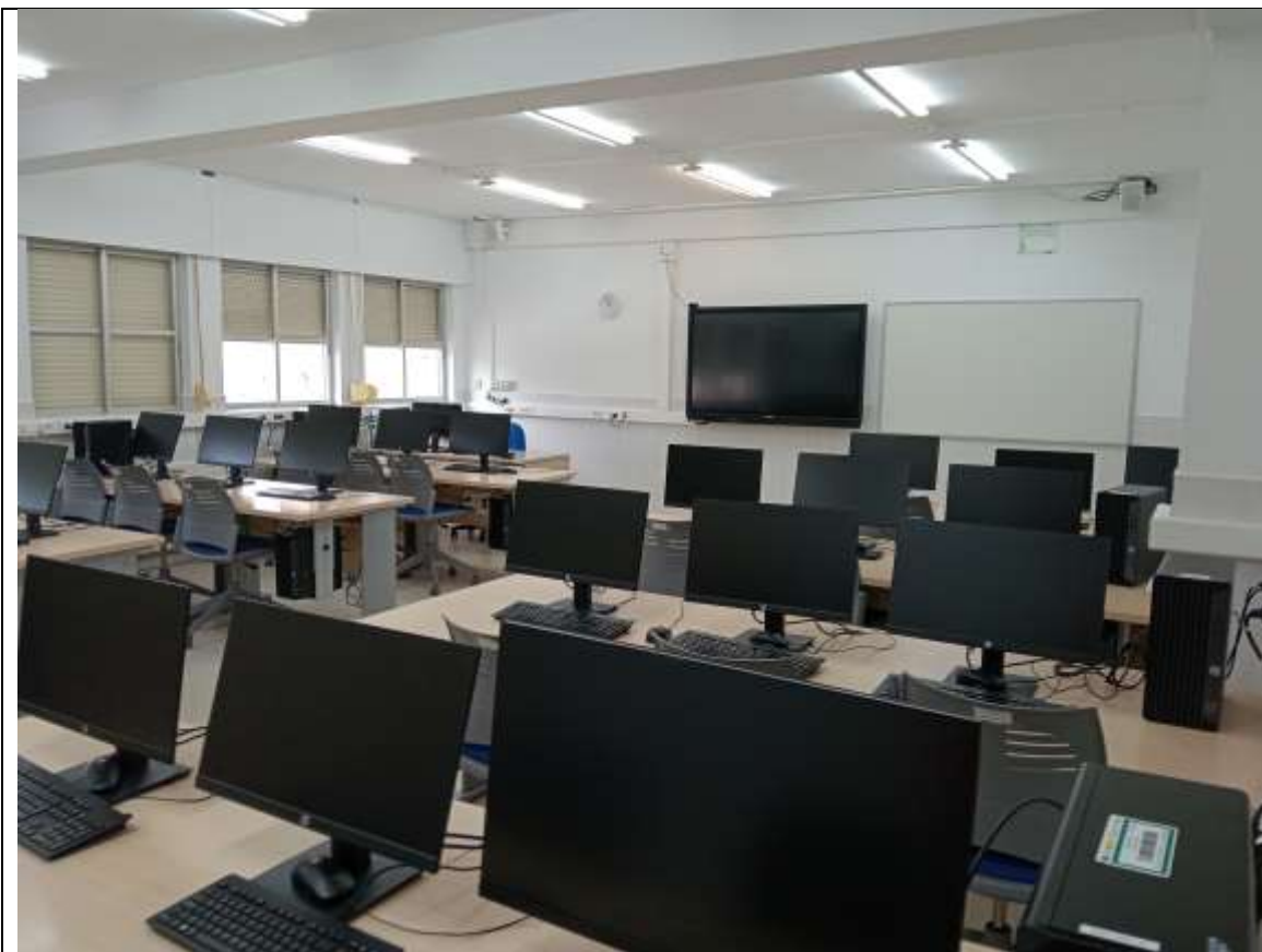
Fotos del material comprado