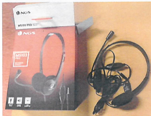
Auriculares con diadema.