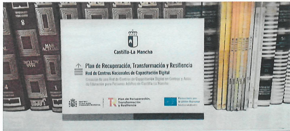
Placa identificativa Centros Capacitación subvencionados por la Unión Europea.