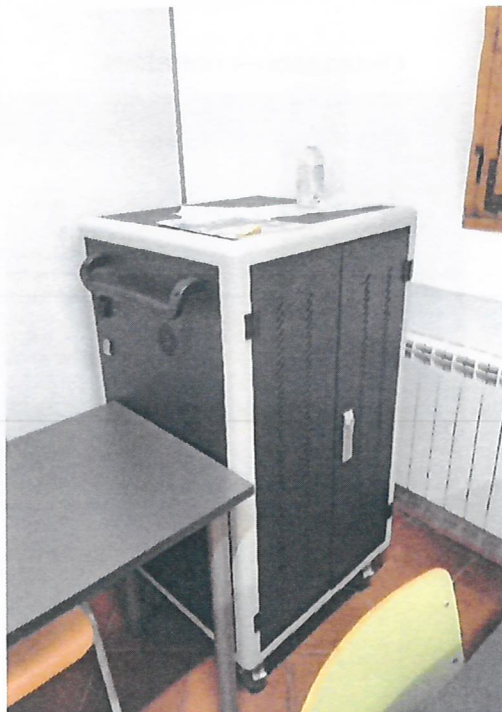
Armario cargador portátiles.