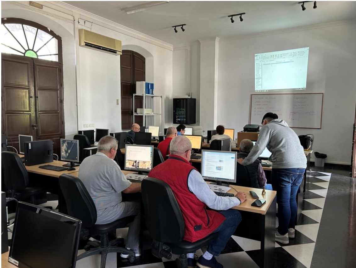
Usuarios del Centro de Capacitación Digital recibiendo la formación