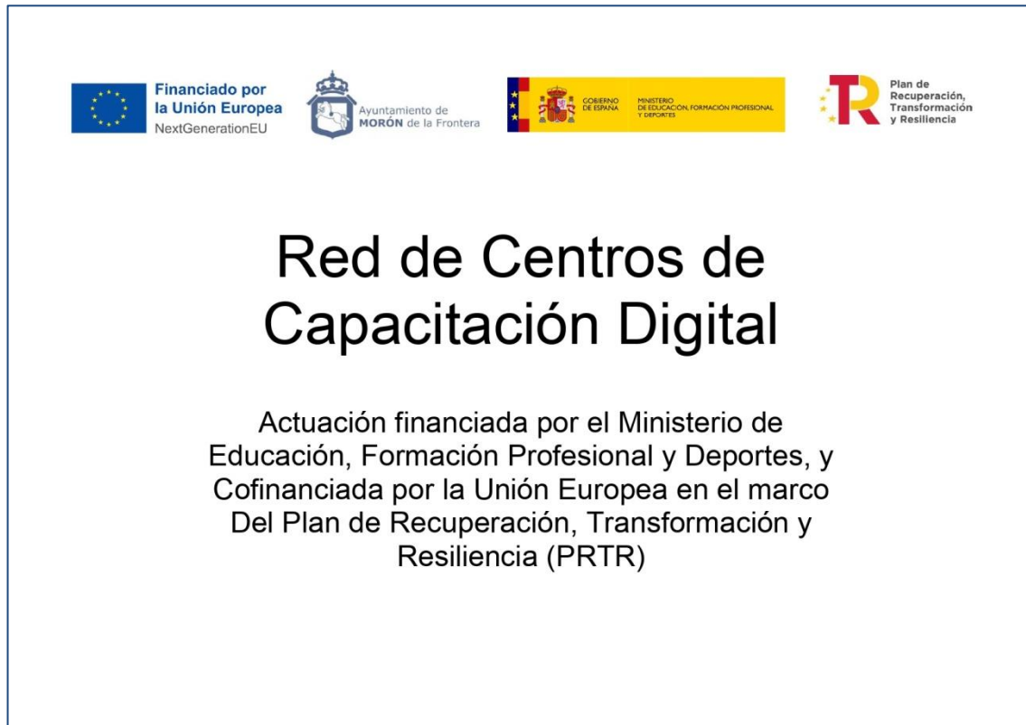
Cartel del Centro de Capacitación Digital