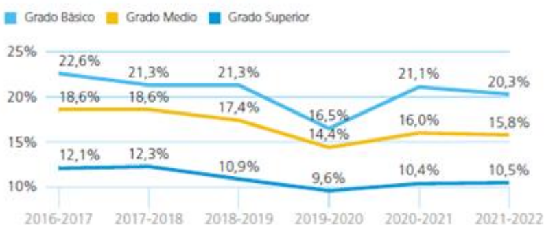
Gráfico 2. Abandono de la FP en 1 er año tras el ingreso por nivel de FP (cohortes 2016-2017 a 2021-2022)

Fuente: elaboración por el Observatorio de la FP a partir de datos de EDUCAbase.