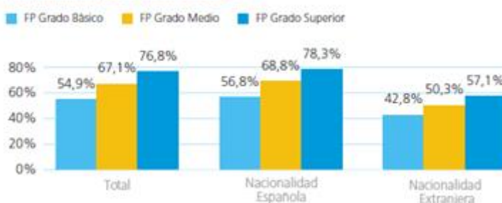
Gráfico 4. Estudiantes de nuevo ingreso que titulan al cuarto año según nacionalidad (cohorte 2018-2019)

Fuente: elaboración por el Observatorio de la FP a partir de datos de EDUCAbase.