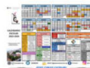
Calendario IES REALEJOS

Las acciones desarrolladas en el centro relacionadas con la actuación «Creación de una red de centros de capacitación digital»