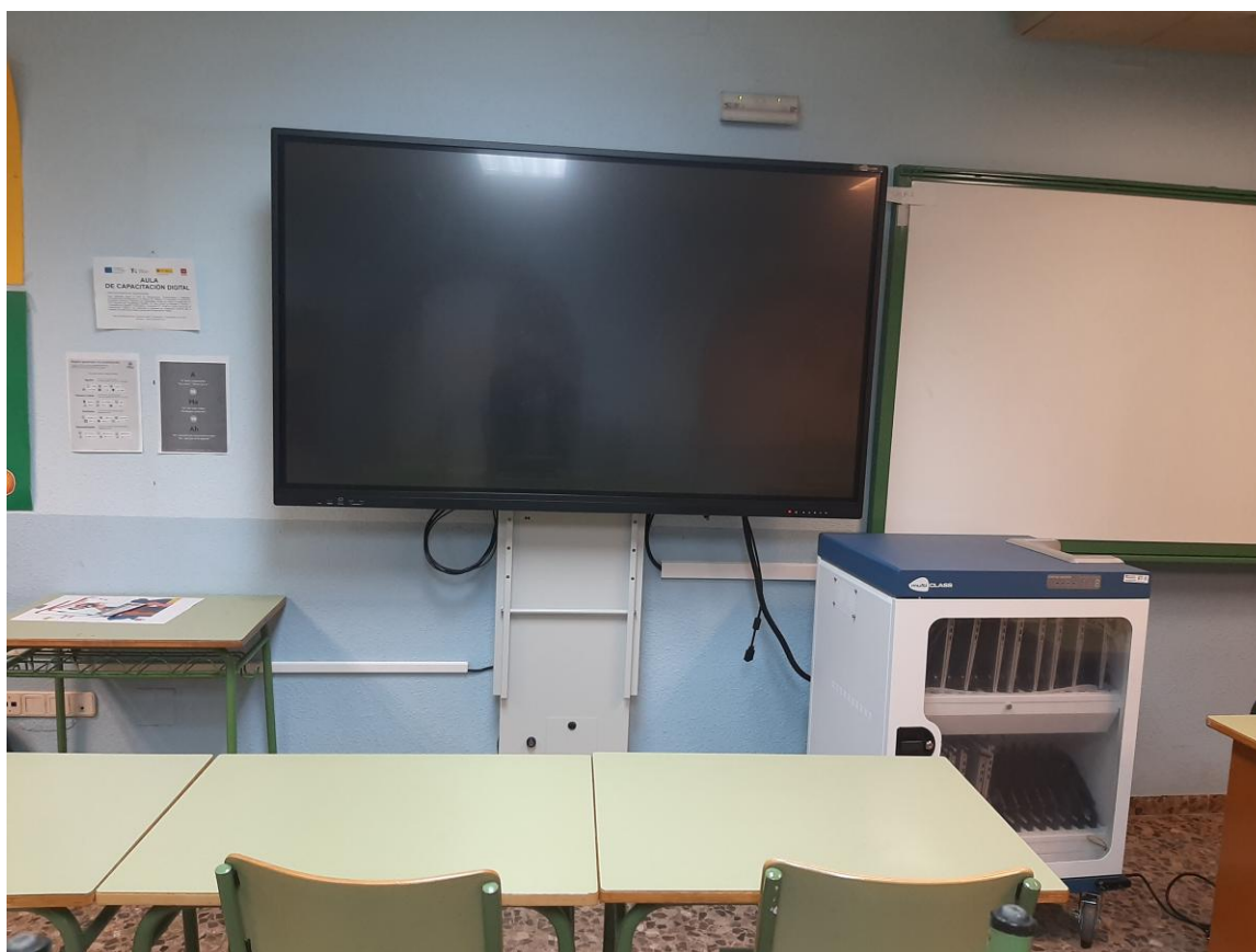
Aula Capacitación digital en Villa del Prado.