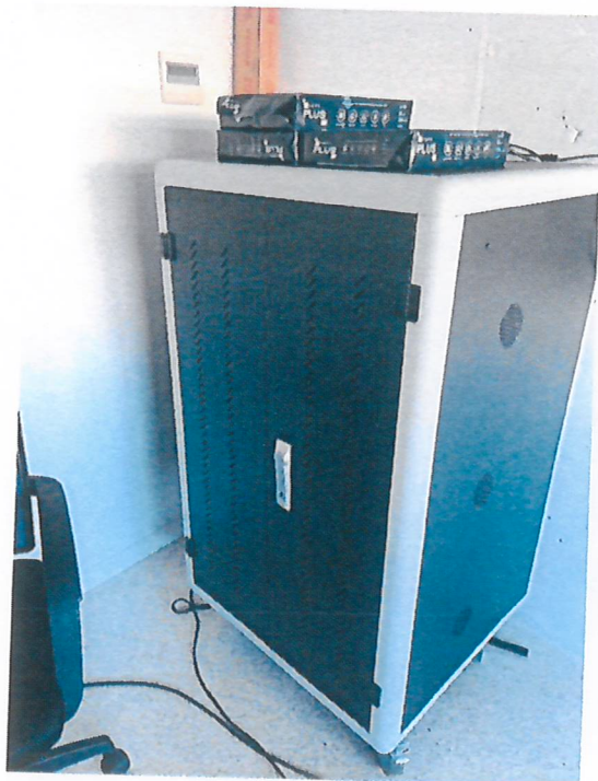
Armario cargador portátiles.