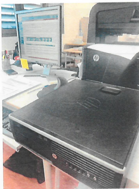
Ordenador sobremesa VICTUS.