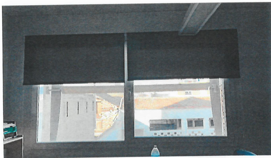
Enrollable modelo Verona.