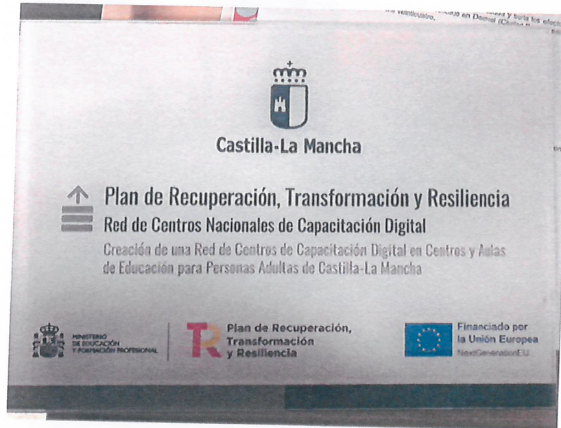
Placa identificativa Centros Capacitación subvencionados por la Unión Europe

Plan de Recuperación, Transformación y Resiliencia