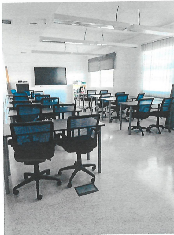
Mesas de formación, sillas giratorias, ordenadores portátiles y pantalla de proyector PHOENIX.