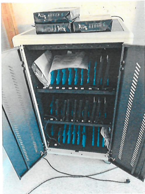
Armario cargador portátiles.