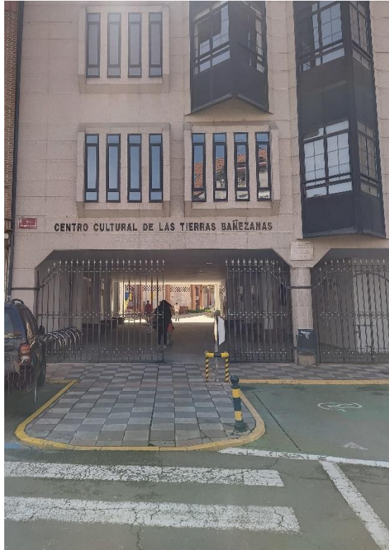
FOTO DE LA PLACA EN LA ENTRADA