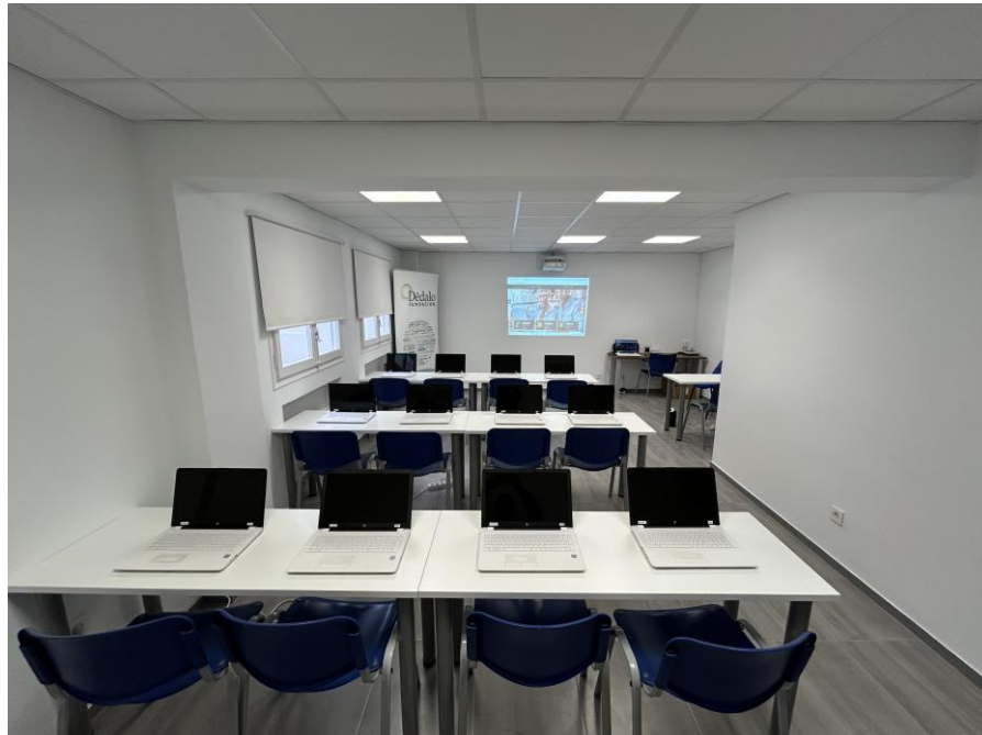
Imagen Placa Centros de Capacitación: